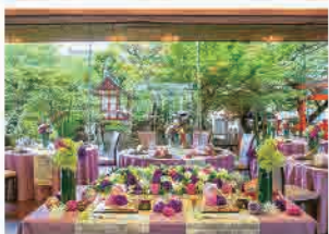
長生殿会場-開放感あふれる全面ガラス