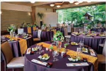
長生殿会場内観イメージ

播磨国総社の境内に佇む別邸「長生殿」 オープンエアな和の会場でお食事と クーリーハイハーモニーのライブをお楽しみ頂けます。